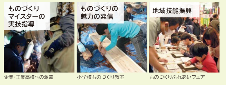
ものづくりマイスターの実技指導 企業・工業高校への派遣

若者のものづくり離れが見られる今日、ものづくり産業の維持・発展のため、 若年技能者の技能向上、技能振興機運の醸成 等を行うことを目的とした事業です。